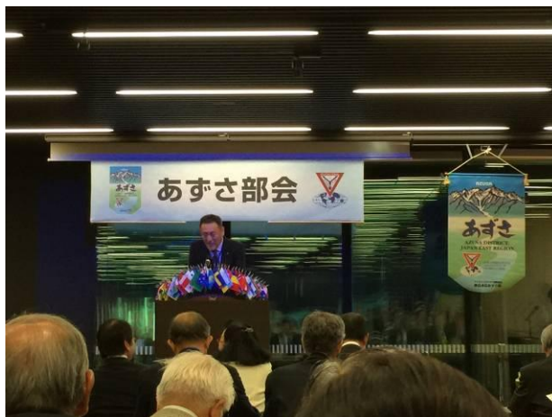
標あずさ部長のあいさつ