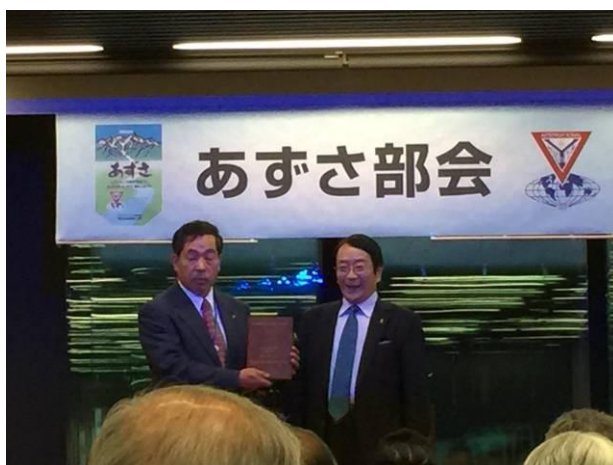
望月メンのエルマークロー賞伝達式