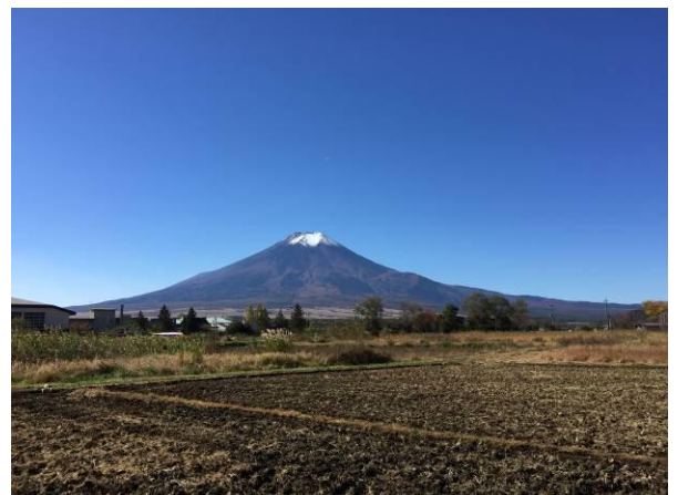
稲刈りを終えた忍野からの富士

会員数 13名 例会出席 12名 例会出席率 92% ニコニコBOX 0円 累計 360円